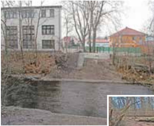
Bild jedoch zeigt, ist die Anbringung jedoch gut vorbereitet. Also ging ich weiter zur Straßenbrücke, um auf die andere Sei-

Überraschung mich dort erwartete. Unterwegs wunderte ich mich darüber, dass mir auf dem sonst gut benutzten Weg niemand entgegen kam. Aus einiger Entfernung sah ich dann, dass am Badeloch eine Absperrung war. Sofort wurde meine Neugier geweckt. Ich fand ne-