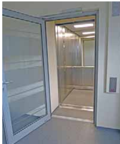
Fahrstuhl innen mit geöffneter Tür

Im Juni 2019 wurde mit etwas Verzögerung die Sanierung der Schulsporthalle abgeschlossen. In diesem 3. Bauabschnitt (nach bereits erfolgter Dach- und Fassadenerneuerung) bekam die Halle einen neuen Fußboden mit darunterliegender Fußbodenheizung. Die Giebel- und Seitenwände wurden mit einem Prallschutz versehen, der gleichzeitig die