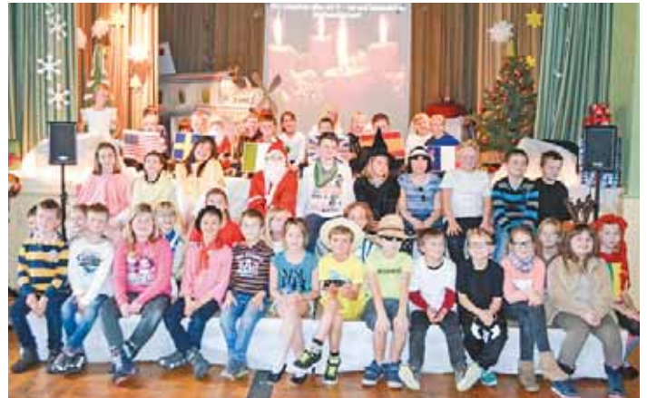
Ein großer Erfolg war die Weihnachtsaufführung mit einer musikalischen Weihnachtsreise um die Welt der Klassen 3a und 3b der Grundschule Neudietendorf.

de in der Vorweihnachtszeit denken viele an diese und engagieren sich stark, damit zumindest einmal das Leid etwas bei Seite geschoben wird. Es ist oft organisiert von Hilfsorganisationen und Vereinen. Hier sei stellvertretend der Arbeitskreis Rumänien genannt, der seit vielen Jahren Hilfsprojekte mit Erfolg umsetzt. Auch der Round Table hat in diesem Jahr mit dem Weihnachtspäckchenkonvoi eine Recordzahl von 106 Tausend Weihnachtspäckchen nach Bulgarien, Moldavien, Rumänien und in die Ukraine bringen können. Die LKWs in die Ukraine haben am 3. Dezember auf der A4 bei Erfurt Halt gemacht und wurden von den Round Tablern Drei Gleichen, Erfurt und Weimar versorgt. Die Fahrer und Mitfahrer freuten sich sehr, weil sie schon einige Stunden unterwegs waren. Und sie hatten viel zu erzählen. Die meisten sind schon seit vielen Jahren mit dabei. Dies liegt an den besonderen Erlebnissen in den Zielgebieten. "Wenn man sieht, wie man die Päckchen bei Kindergartenkindern abholt, verlädt, transportiert und dann z.B. in der Ukraine einem Kind wieder übergibt, sind es unbeschreibliche Gefühle." Das nächste Treffen des Round Table Drei Gleichen ist am 10. Januar um 19 Uhr im Bürgerhaus Apfelstädt. Mehr Infos unter facebook.com/TRDreiGleichen. von JM