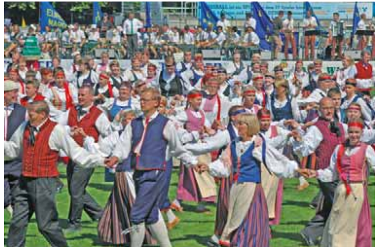
Abschlussveranstaltung der Europeade 2013 in Gotha.

Fanfaren- und Showorchester Gotha begleitet, welches durch die Stadt Gotha und den Landkreis Gotha wieder als touristischer und kultureller Botschafter des Gothaer Landes nach Belgien entsandt