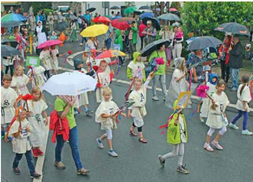
Das Highlight der Feierlichkeiten, der große Festumzug am Sonntag.

Grabsleben 825 Jahre Grabsleben sind nun schon wieder Geschichte und wir alle haben eine sehr schöne Festwoche erlebt, die unseren Ortsteil Grabsleben und die gesamte Gemeinde Drei Gleichen präsentiert und wieder ein Stück näher und zusammengebracht hat. Im Verlauf dieser Festwoche haben viele verschiedene Aktivitäten stattgefunden.