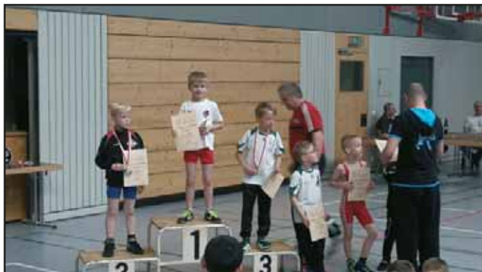
Text und Fotos: Ringer Mühlberg