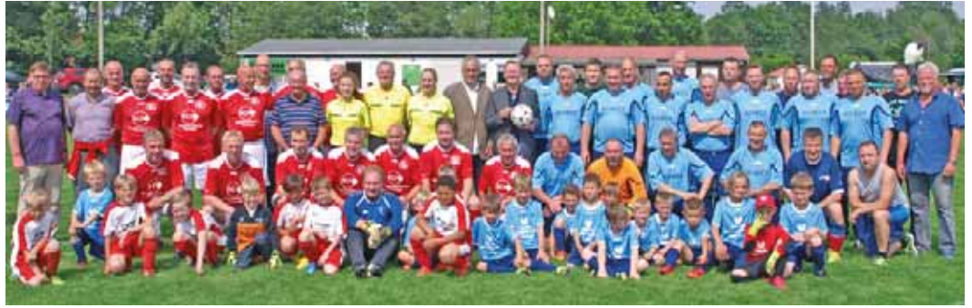
Die Mannschaften des Spieltages mit Ehrengast Ministerpräsident Bodo Ramelow.

Ingersleben Am 4. Juni schickten die Alten Herren von Ingersleben, die DDR Juniorenmeister von Rot Weiß Erfurt 1980, in die „Fußballrente“. Um 14 Uhr spielten die D Junioren des JFC Nesse Apfelstädt gegen den Tabellenersten Rot Weiß Erfurt und schafften vor einem großen Publikum eine kleine Sensation. Sie siegten mit 6:5. Super gemacht Jungs! Schon während des Spiels wurde im Festzelt Kuchen gereicht. Die Jungen Frauen unserer Alten Herren haben sich mit der Anzahl der Bleche und den Kuchenrezepten wieder einmal selbst übertroffen. Danke Mädels! Kurz vor 16 Uhr kam dann ein wenig Aufregung auf dem Fußballgelände auf. Die Fahrzeuge des Ministerpräsidenten von Thüringen, Bodo Ramelow, fuhren