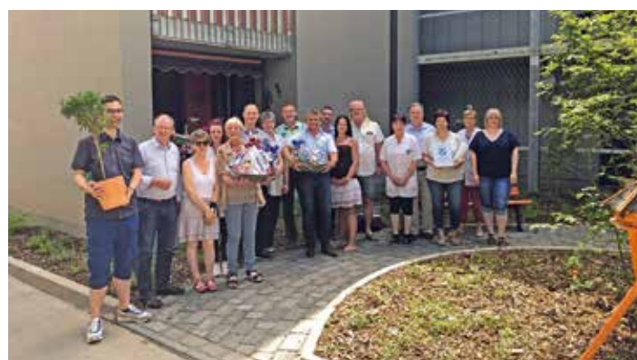
2019 - Eröffnung Seniorenwohnen Am Zinzendorfspark.

Infos unter Tel.: 032020 20797 oder www.hk-pflegedienst.de vom HK Pflegedienst