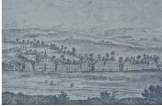
"Gnadenthal", ein Kupferstich von ca. 1764 mit den früheren Hausfassaden. Zu sehen im Heimatmuseum Ingersleben, das wieder immer sonntags von 14 bis 18 Uhr geöffnet ist.

Das ist das Erbe, das vor vier Jahren fünf junge Familien mit großem Mut angetreten haben, um in diesem alten, teils verschlissenen Ensemble Wohnungen zu schaffen. Das erste Jahr nannten sie ihre Findungszeit des „Wohngutes“.